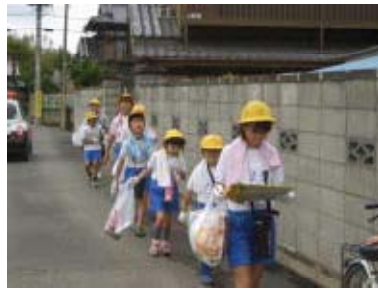
班で協力してごみ拾い