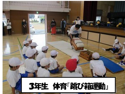
3年生 体育「跳び箱運動」