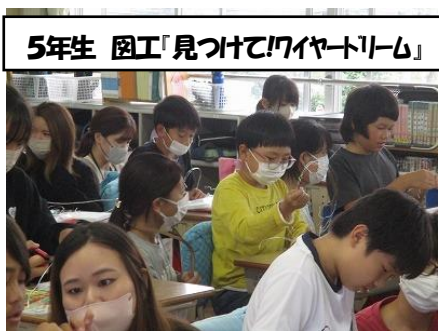
5年生 図工「見つけて！7イヤートリム」