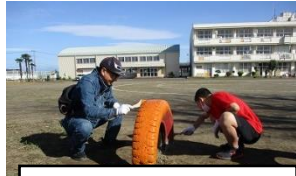
遊具用タイヤのペンキ塗り