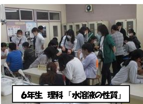
6年生 理科「水溶液の性質」