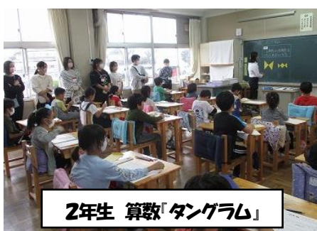
2年生 算数「タングラム」