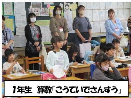
1年生 算数「こういでさんすう」

10月4日(水)に授業参観を行いました。お忙しい中、子供たちが授業に臨む様子をご覧いただき、ありがとうございました。