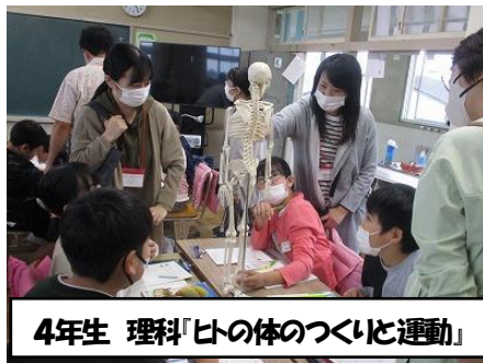
4年生 理科「ヒの体のつくりと運動」