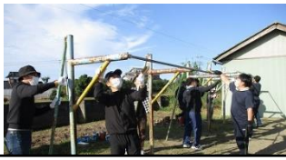
高鉄棒のさび落としとペンキ塗り

10月7日(土)に、4年ぶりに PTA 奉仕作業を行うことができました。総勢80名で、これまでなかなか手が回らなかった作業をしていただき、校舎内外、様々な部分が大変きれいになりました。子供たちが、安全で楽しい学校生活を送ることができるように、代々引き継がれてきた赤麻小の施設・設備を、これからも大切に使用させていただきます。ご協力いただいた皆様、大変お世話になりました。心より感謝申し上げます。ありがとうございました。